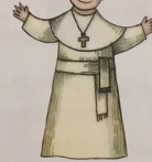
Juan Pablo II (1978-2005)