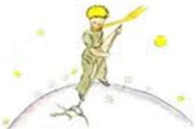
- Antoine de Saint-Exupéry, écrivain français.

“ Toutes les grandes personnes ont d'abord été des enfants, mais peu d'entre elles s'en souviennent. ”