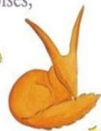
Le Petit Prince