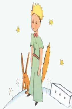
Le Petit Prince

Le Petit Prince - Antoine de Saint Exupéry