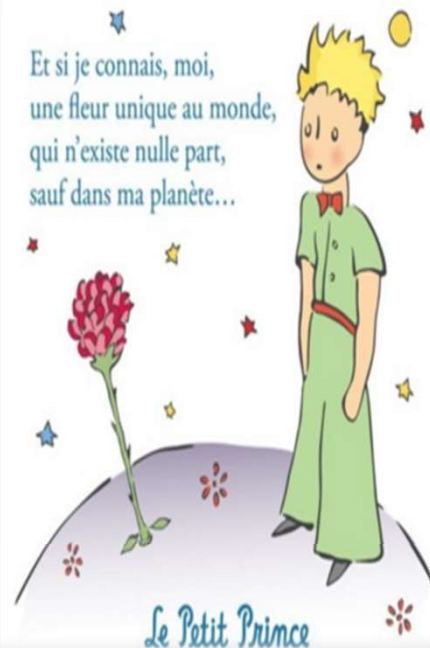
Le Petit Prince