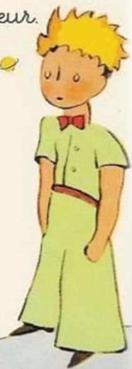
Le Petit Prince

On ne voit bien qu'avec le cœur. L'essentiel est invisible pour les yeux.